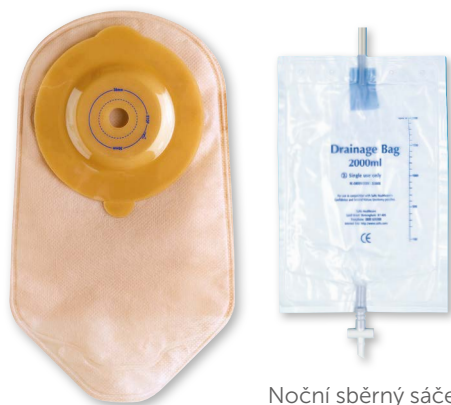
Noční sběrný sáček