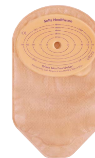
Sáček s oválnou podložkou