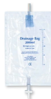
Noční sběrný sáček

** Sáčky Confidence® Gold s oválnou podložkou lze vystřihnout do rozměru 110mm na šířku a 70mm na výšku, nejsou však vybaveny podložkou Flexifit® s Aloe vera.