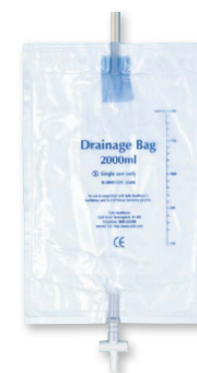
Noční sběrný sáček

* Sáčky s otvorem 13mm mohou být vystříženy do rozměru 70mm na šířku a 55mm na výšku.