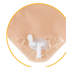
Pákový uzavírací ventil s širokou výpustí a integrovanou krytkou